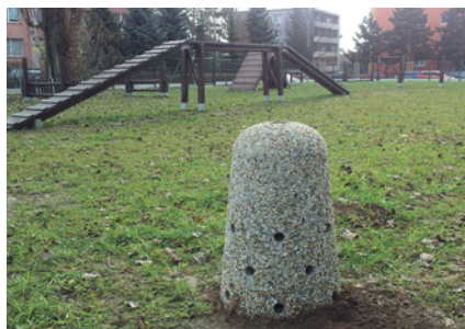
Betonový psí pisoár Solitér v povrchu Dunaj