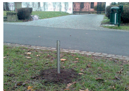
Nerezový psí pisoár