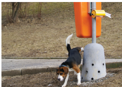
Betonový psí pisoár Komplet v povrchu Natur